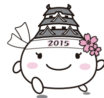
「しろまるひめ」 (マラソンバージョン)