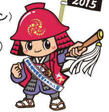
「かんぺえくん」 (マラソンバージョン)